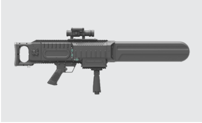
DRONE HUNTER XR3

백팩형의 단점인 무거운 무게를 5 kg 이하로 경량화 한 백팩형 전파 차단 장비로 기동성과 고출력 차단 성능 제공.