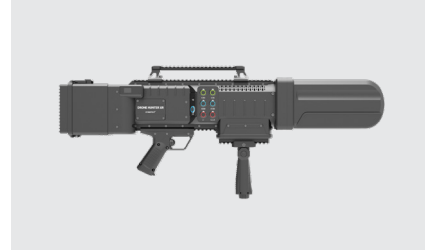
DRONE HUNTER XR7

혁신시제품 지정, 안테나·메인 제어부·배터리 일체형 (All-in-One) 디자인으로 경량화를 자랑하며 강력한 차단 성능 유지.