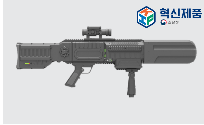
DRONE HUNTER XR6

백팩형의 단점인 무거운 무게를 5 kg 이하로 경량화 한 백팩형 전파 차단 장비로 기동성과 고출력 차단 성능 제공.